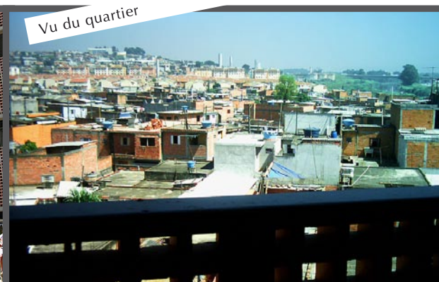
Vu du quartier