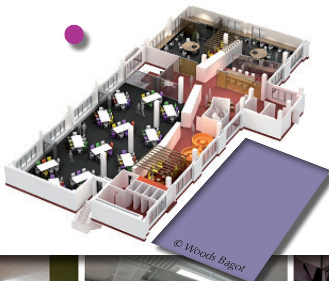
Graphique 4. Vue du concept montrant les espaces d'apprentissage collaboratif, les étudiants, la galerie et l'espace d'apprentissage informel que représente le café

Inauguré en avril 2010, cet équipement fut conçu pour 100 étudiants de 4 e année et 30 doctorants en ingénierie.