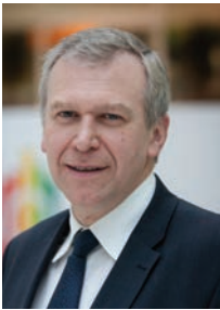
Yves Leterme Secrétaire général adjoint de l'OCDE

L'entrepreneuriat social, forme d'entrepreneuriat qui vise à concilier viabilité économique et impact social, fait l'objet d'un intérêt croissant de la part des décideurs politiques comme du grand public. L'augmentation des créations d'entreprises sociales, l'éclosion de chaires dédiées à cette thématique dans les écoles de commerce, la multiplication des incubateurs d'entreprises sociales, l'organisation de conférences et séminaires portant sur l'émergence de ce phénomène soulignent la vivacité de cet intérêt.