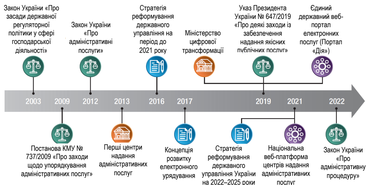
Рисунок 1. Огляд ініціатив реформування сфери надання адміністративних послуг в Україні